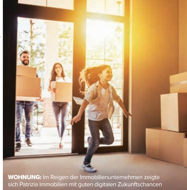
WOHNUNG: Im Reigen der Immobilienunternehmen zeigt sich Patrizia Immobilien mit guten digitalen Zukunftschancen