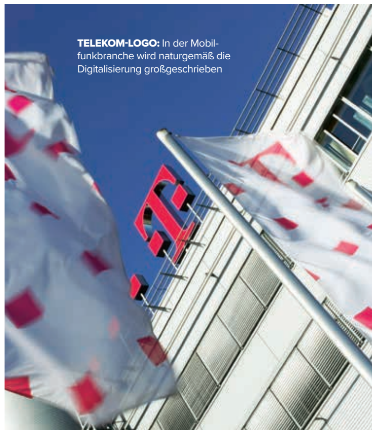
TELEKOM-LOGO: In der Mobilfunkbranche wird naturgemäß die Digitalisierung großgeschrieben