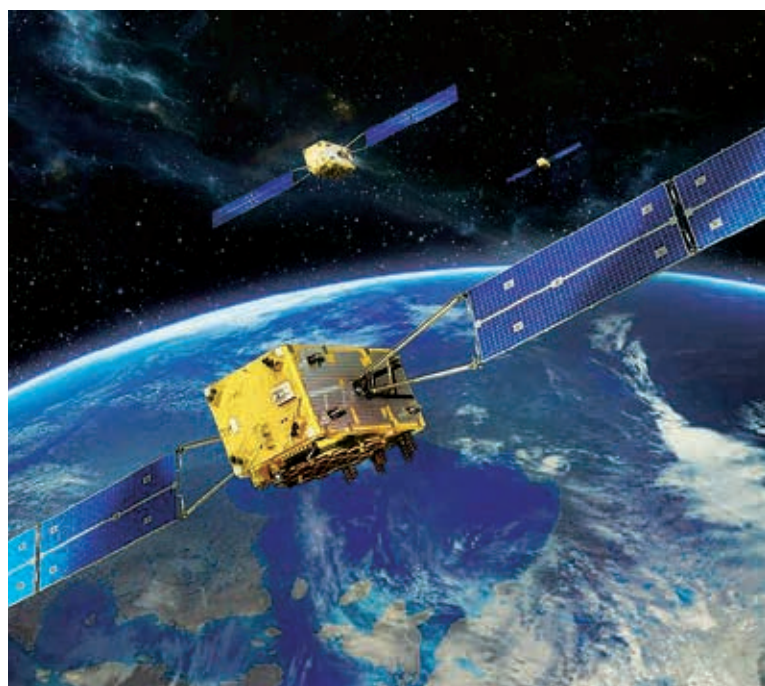
SATELLIT: Spezialist OHB punktet – auch mit seiner Luftfahrtsparte