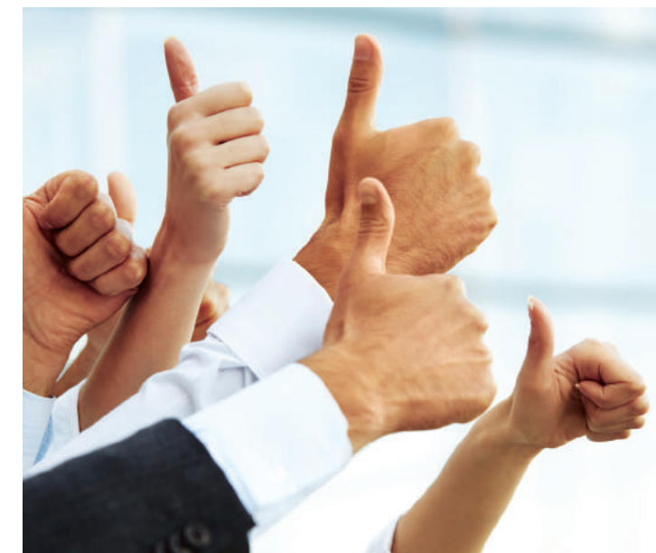
Daumen hoch Gleichstellung im Team als Erfolgsgrundlage